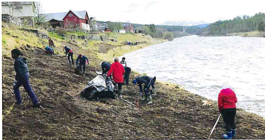
9. trinn ved Tolga skole i full aktivitet våren 2020