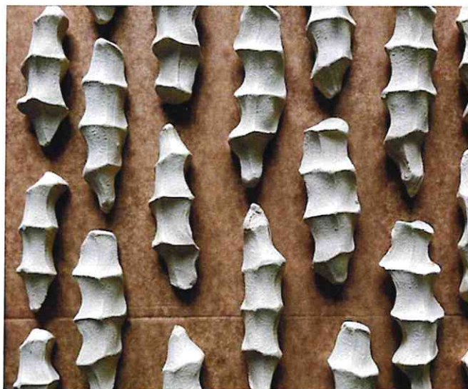
Leiren tørkes og brennes.