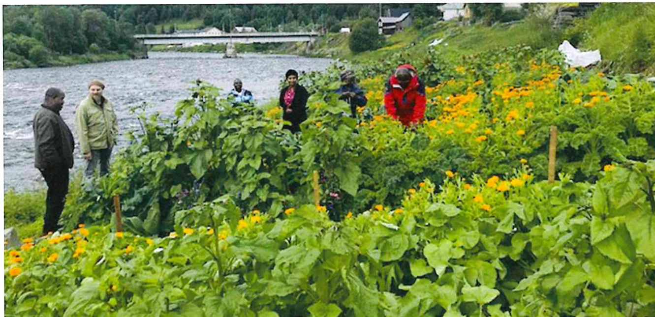
Her kan en se det flotte resultatet fra Flykningstjenestens parsell 2020.