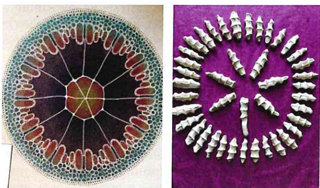
Eksempler på mønster hvordan sette håndtrykkene sammen.