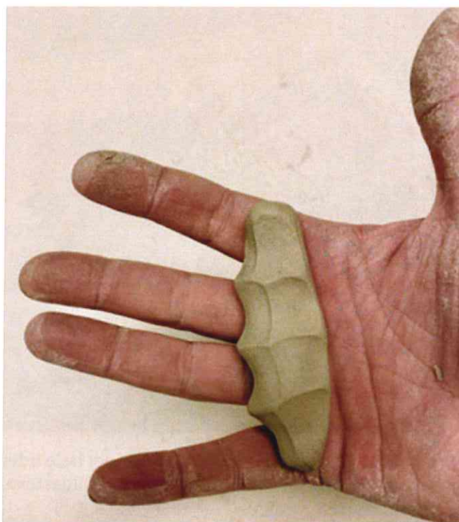
Workshop 1: Håndklem i leire Workshop.