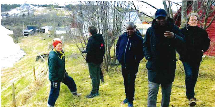
Befaring våren 2020.

Dette prosjektets målsetting er å rehabilitere et sentralt beliggende kulturlandskap i Tolga sentrum gjennom å gjenoppta den aktiviteten området originalt ble brukt til: dyrking av mat, samt å istandsette områdets mange tørrmurer. Området ligger i skråningen mellom den gamle «Gata» i Tolga og Glomma, og har historisk blitt brukt av de som bodde i sentrumsgårdene. På disse gårdene bodde arbeiderne ved Tolgen Smeltehytte som ble etablert i 1670. Dette prosjektet eies av Tolga kommune i tett samarbeid med de private grunneierne som eier hver sine deler av området (i alt åtte grunneiere), og lokale aktører innen landbruk, skole, helse og inkludering, som er interessert i å ta i bruk området til dyrking og tilknyttet, relevant aktivitet. Prosjektet fortsetter i 2021. Da blir det større aktivitet i hagen. Flere grunneierne tar i bruk deler av sine parseller, samtidig fortsetter Tolga skole, 9. trinn og flykningstjenesten med sine parseller.