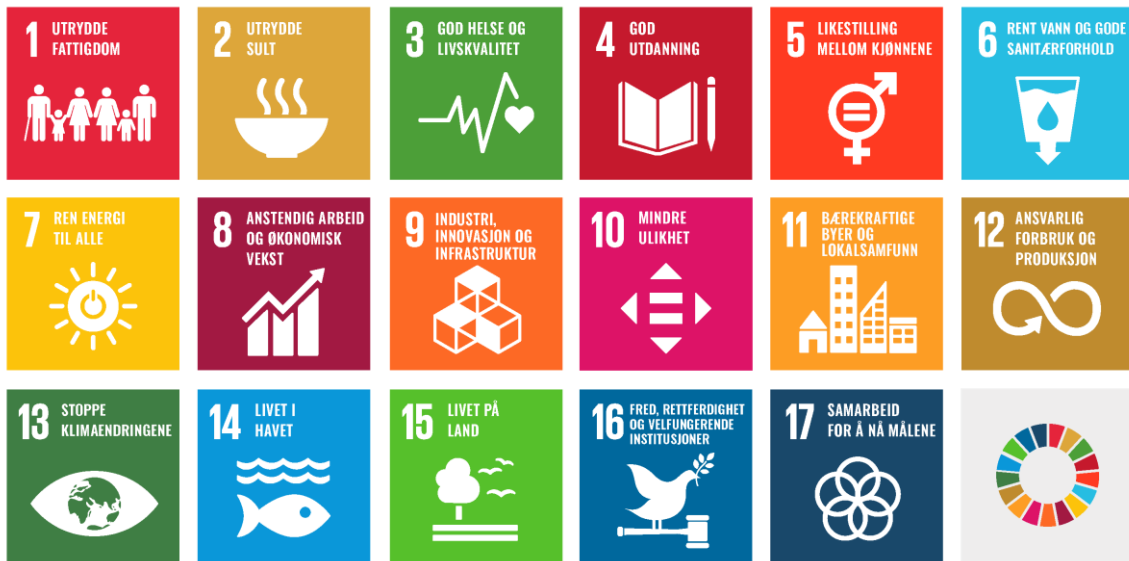
Fig.3 FN's bærekraftsmål

2015 vedtok FNs generalforsamling 17 bærekraftsmål. Disse skal fungere som en felles global retning for land, næringsliv og sivilsamfunn i arbeidet med bærekraftig utvikling frem mot 2030. Regjeringen har bestemt at FNs 17 bærekraftsmål skal være det politiske hovedsporet for å ta tak i vår tids største utfordringer. Fylkeskommuner og kommuner er nøkkelaktører for å realisere en bærekraftig samfunnsutvikling, og bærekraftsmålene skal derfor være en del av grunnlaget for samfunns- og arealplanleggingen i kommunene.