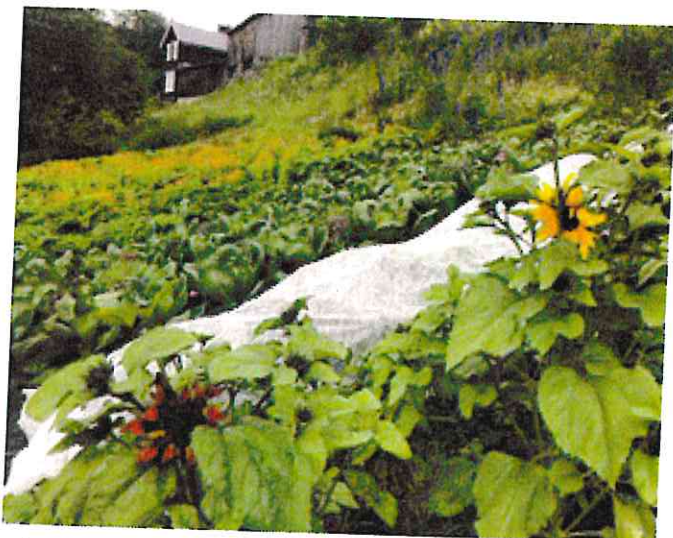
Kål og blomster vokste godt.