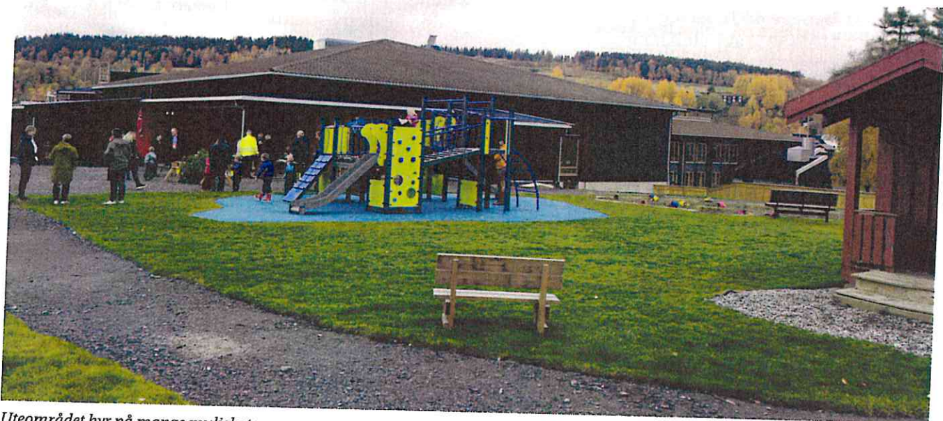
Uteområdet byr på mange muligheter.