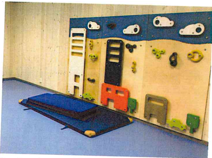
Barnehagen har eget fellesrom for alle avdelinger.