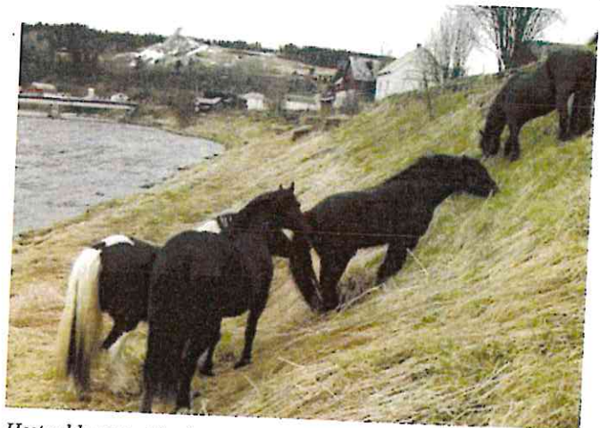
Hester ble satt ut for å gnage ned fenne.