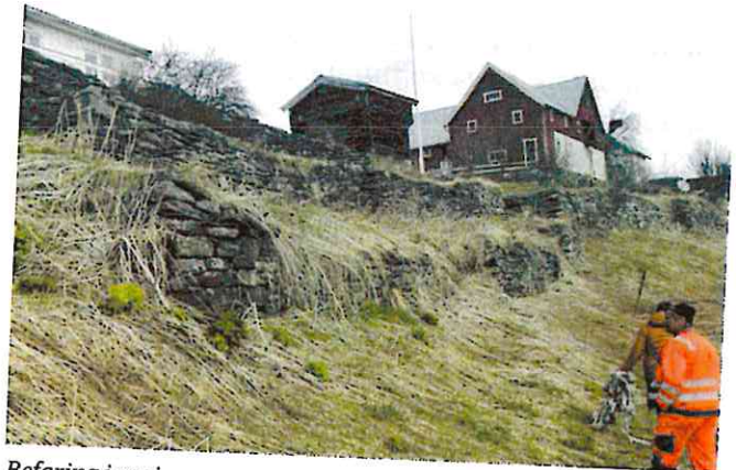
Befaring i mai.

Kanskje har du sett aktivitet i de gamle sentrumshagene i løpet av sommeren. Kjøkkenhageprosjektets målsetting er å rehabilitere et sentralt beliggende kulturlandskap i Tolga sentrum gjennom å gjenoppta den aktiviteten området originalt ble brukt til: Dyrking av mat, samt å istandsette områdets mange tørrmurer. Området ligger i skråningen mellom den gamle «Gata» i Tolga og Glomma, og har historisk blitt brukt av de som bodde i sentrumsgårdene. På disse gårdene bodde arbeiderne ved Tolgen Smeltehytte som ble etablert i 1670. Kjøkkenhageprosjektet eies av Tolga kommune i tett samarbeid med de private grunneierne som eier hver sine deler av området (i alt åtte grunneiere), og lokale aktører innen landbruk, skole, helse og inkludering, som er interessert i å ta i bruk området til dyrking og relevant aktivitet. Befaring ble gjennomført 14.mai 2020. Området var opprinnelig hauger med slagg hvor det ble bygd opp steinmurer, og tilkjørt matjord og hestegjødsel. Til nå er det registrert 118 tørrmurer på vestsiden av Glomma i Tolga sentrum og nordover Erlia. Mange av disse ligger i skråningen fra brua og opp til Snekkargarden, altså på hele nedsiden av Gata. I juni plantet elever ved Tolga skole og flyktning-tjenesten med god hjelp fra Fjellurt. Elever og flyktninger gjorde en kjempeinnsats med kjøkkenhagene og i løpet av høsten kunne det høstes godt fra avlingene. 2020 er et prøveår for å se hvordan opplegget fungerer.