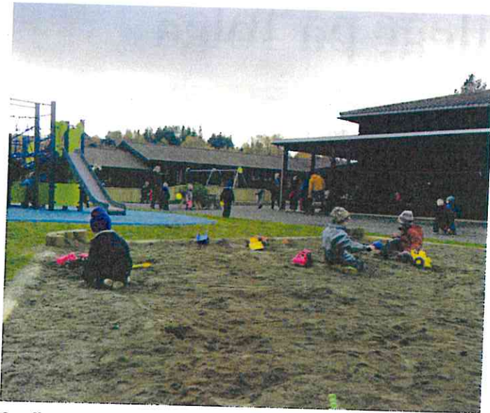
Sandkassa er populær.