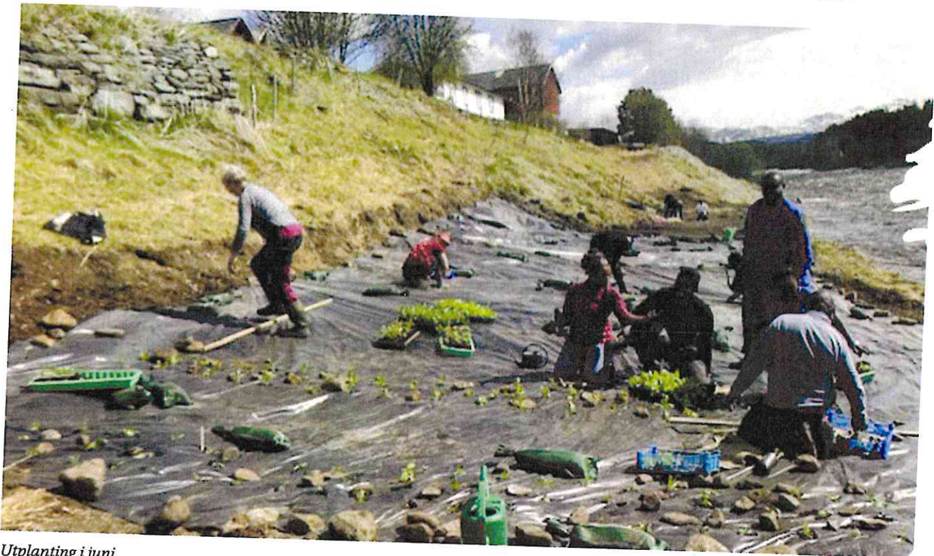
Utplanting i juni.