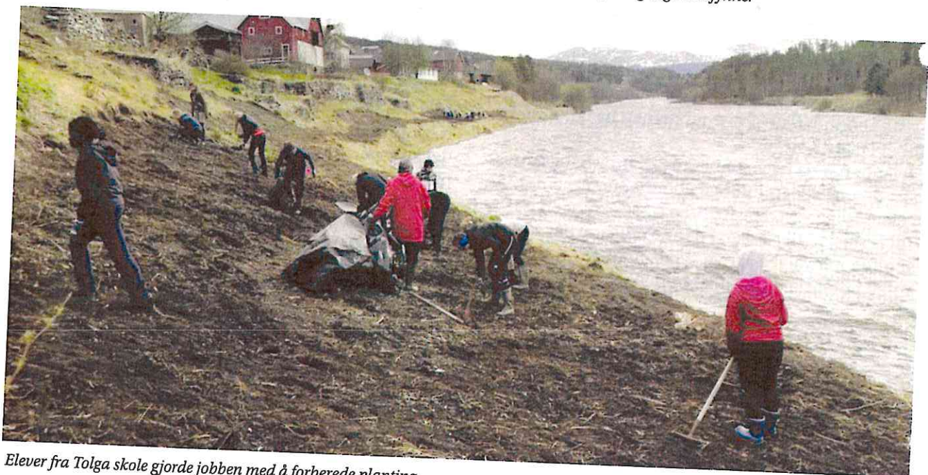
Elever fra Tolga skole gjorde jobben med å forberede planting.