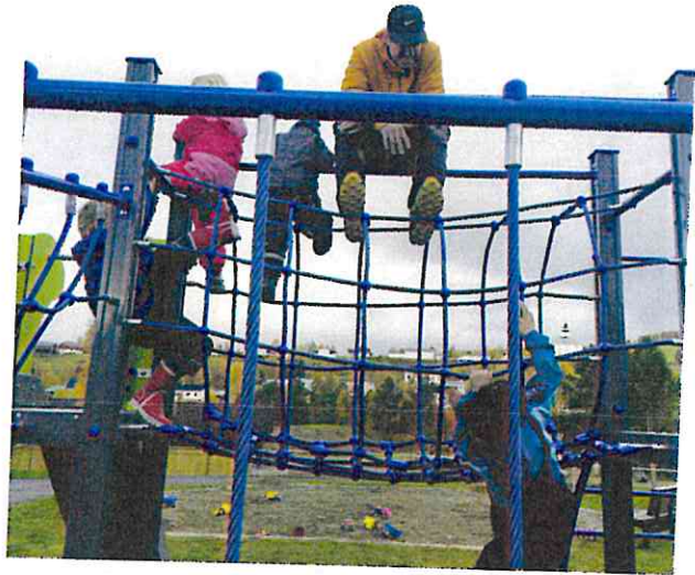
Høyt henger de og blide er de.